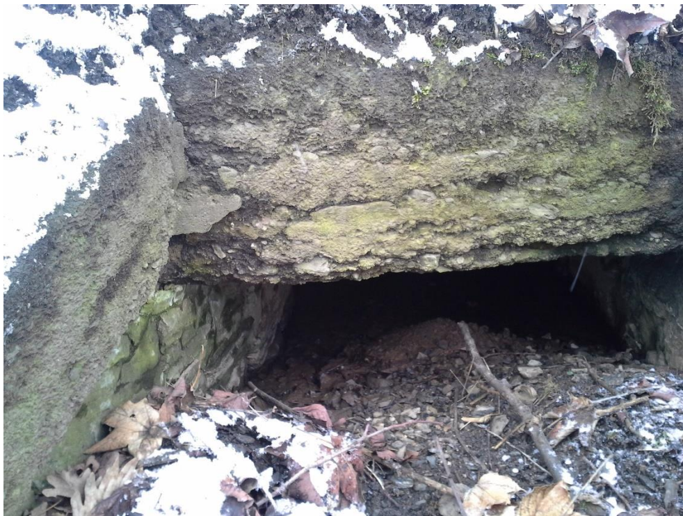
Foto 3: Částečně zanesená výtoková strana, navětralé kamenné čelo propustku